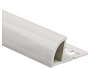
LIŠTA PRO VNĚJŠÍ ROHY: - PŮLKULATÁ, PLAST, BÍLÁ